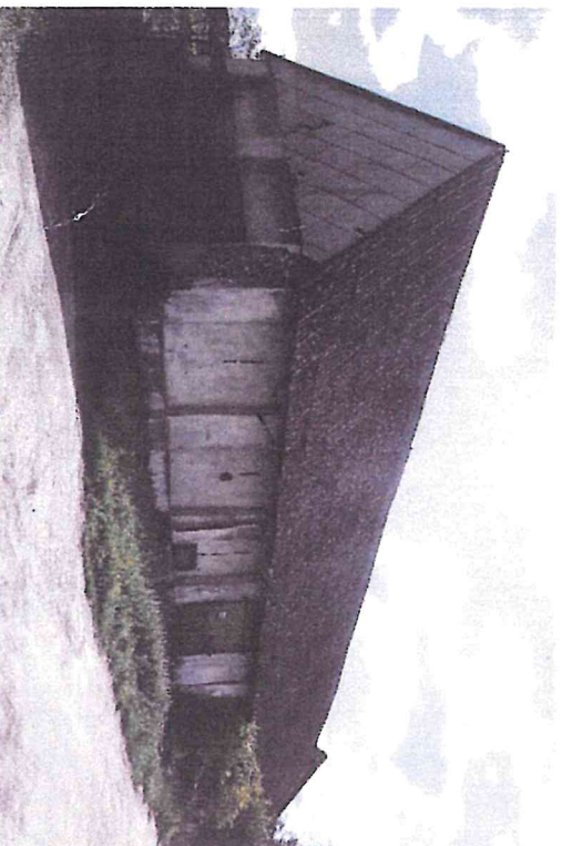
Widok budynku od północnego- wschodu