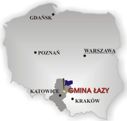
Rysunek 2 Gmina Łazy – zarys obszaru

Gmina graniczy od północy z gminami miejskimi: Porębą i Zawierciem, od wschodu z gminą miejsko-wiejską Ogrodzieniec i gminą wiejską Klucze, od południa z gminą miejską Dąbrowa Górnicza, od zachodu gminą miejsko-wiejską Siewierz.