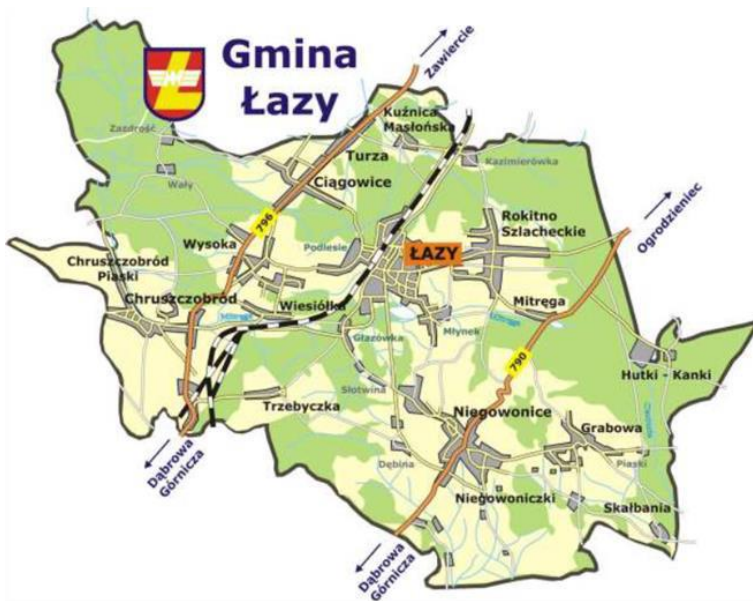
Rysunek 1 Mapa Łaz